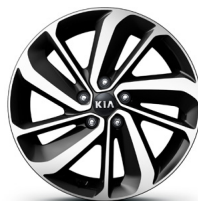
18" Leichtmetall Felgen (Option) Jantes en alliage léger 18" (option) Cerchi in lega leggera 18" (opzione)

KIA Motors AG behält sich das Recht vor, jederzeit und ohne vorherige Ankündigung Ausrüstung und Preise ihrer Modelle zu ändern. Bei den technischen Daten handelt es sich um Werksangaben. Irrtum und Druckfehler vorbehalten.