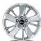
16" Leichtmetall Felgen (Classic + Trend) Jantes en alliage léger 16" (Classic + Trend) Cerchi in lega leggera 16" (Classic + Trend)

• serienmässig / de serie / di serie – nicht lieferbar / pas livrable / non disponibili