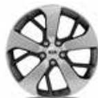
18" Leichtmetall Felgen (Style GT-Line + Style GT) Jantes en alliage léger 18" (Style GT-Line + Style GT) Cerchi in lega leggera 18" (Style GT-Line + Style GT)

KIA Motors AG behält sich das Recht vor, jederzeit und ohne vorherige Ankündigung Ausrüstung und Preise ihrer Modelle zu ändern. Bei den technischen Daten handelt es sich um Werksangaben. Irrtum und Druckfehler vorbehalten. / La KIA Motors SA se réserve le droit de modifier en tout temps et sans préavis l'équipement et les prix de ses modèles. Les données techniques sont des indications de l'usine. Sous réserve d'erreurs et de fautes d'impression. / KIA Motors SA si riserva il diritto di modificare in qualsiasi momento e senza preavviso l'equipaggiamento e i prezzi dei suoi modelli. Le caratteristiche tecniche si riferiscono ai dati di fabbrica. Con riserva di errori ed omissioni.