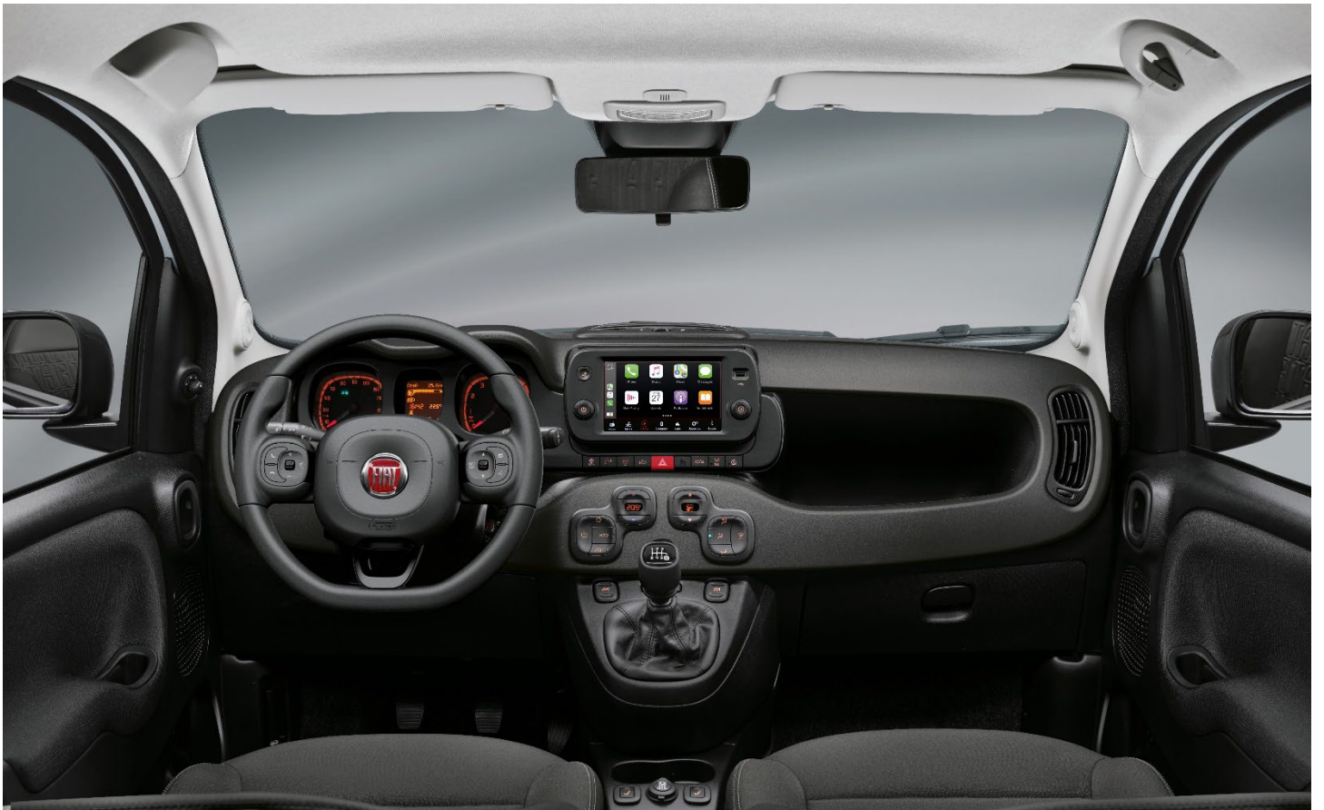
Pack City Life Plus / Cross