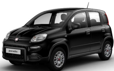
601 Cinema Schwarz