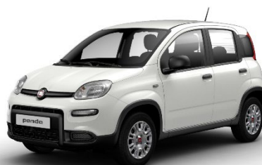
296 Gelato Weiss