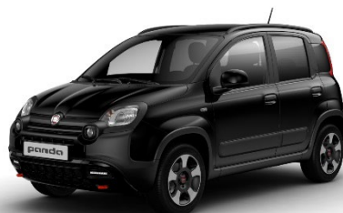
601 Cinema Schwarz