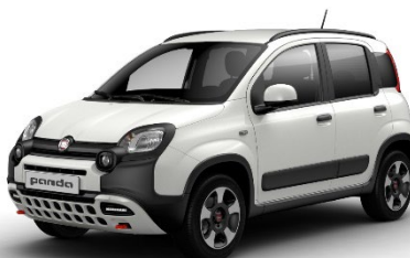
296 Gelato Weiss