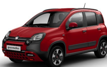
414 Amore Rot