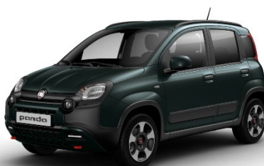
468 Foresta Grün