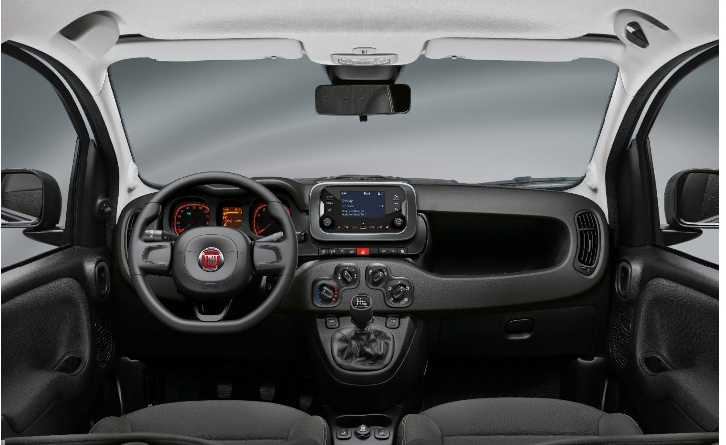
Cult / City Life