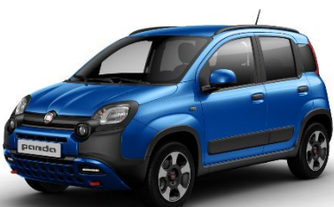
756 Italia Blau