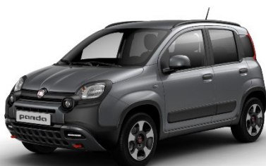
581 Colosseo Grau