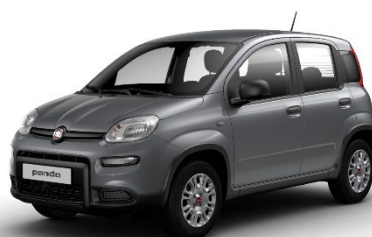
581 Colosseo Grau