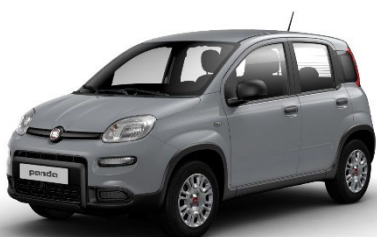
785 Moda Grau