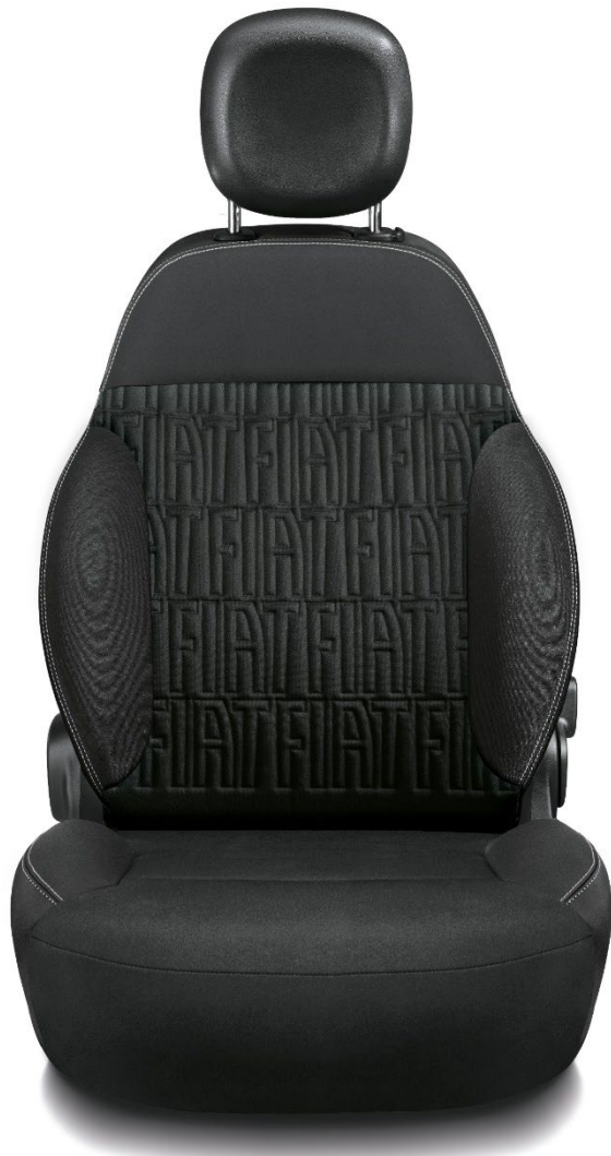
Schwarze Stoffsitze mit FIAT-Monogramm