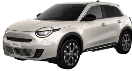
Sand - Earth of Italy