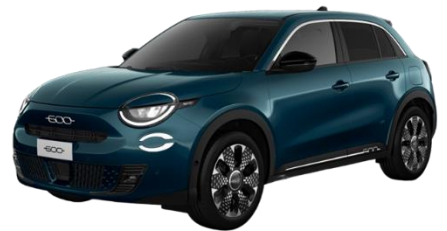
Grün - Sea of Italy