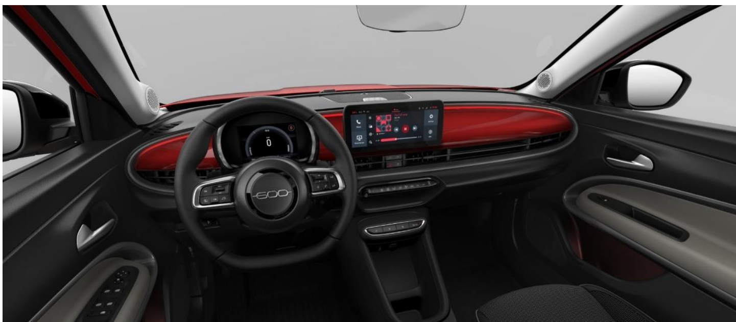
Armaturenbretteinlage in Wagenfarbe lackiert