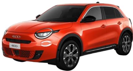
Orange - Sun of Italy