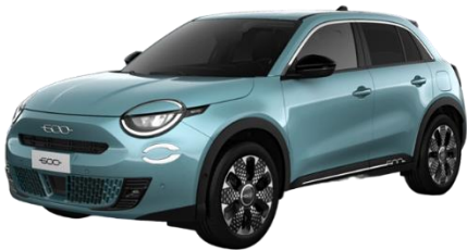
Blau - Sky of Italy