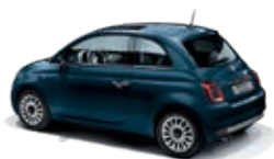
687 Dipinto di blu Blau