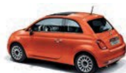
562 Spritz Orange