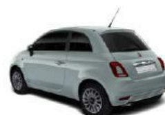
196 Rugiada Grün