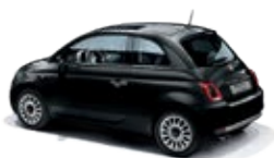
876 Vesuvio Schwarz