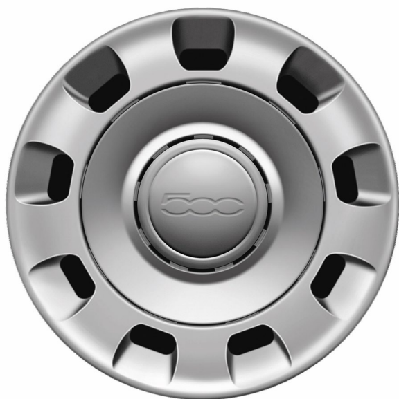
14" Stahlfelge 175/65 R14 (CULT)