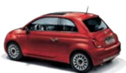
111 Passione Rot