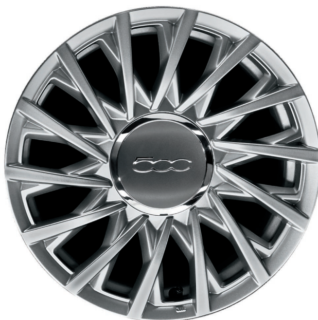
15" Leichtmetallfelge 185/55 R15 (LOUNGE)